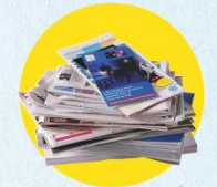
Papiers, journaux, magazines