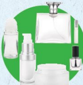
Flacons de cosmétique

(déodorants, pots et flacons, vernis à ongles, parfums...)