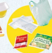
Sacs et sachets