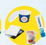
Pots et boîtes