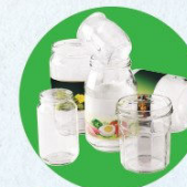
Pots, bocaux, flacons