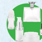
Flacons de cosmétique

(déodorants, pots et flacons, vernis à ongles, parfums...)