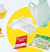
Sacs et sachets