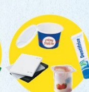
Pots et boîtes