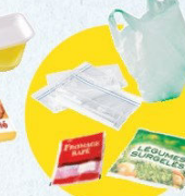
Sacs et sachets