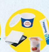
Pots et boîtes