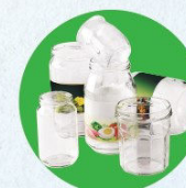
Pots, bocaux, flacons