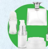
Flacons de cosmétique

(déodorants, pots et flacons, vernis à ongles, parfums...)