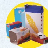
Emballages en carton