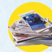
Papiers, journaux, magazines