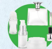
Flacons de cosmétique

(déodorants, pots et flacons, vernis à ongles, parfums...)