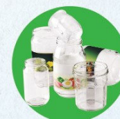
Pots, bocaux, flacons