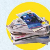
Papiers, journaux, magazines