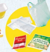
Sacs et sachets