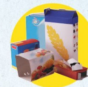
Emballages en carton