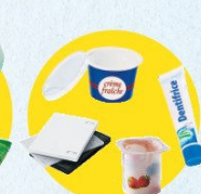
Pots et boîtes