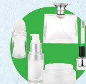
Flacons de cosmétique

(déodorants, pots et flacons, vernis à ongles, parfums...)