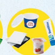
Pots et boîtes