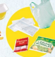
Sacs et sachets