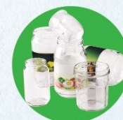
Pots, bocaux, flacons