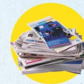
Papiers, journaux, magazines