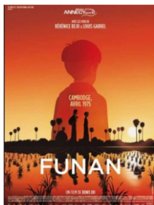
Funan de Denis Do ► Arcs Film Festival 15-22 décembre 2018