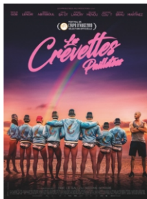
Les Crevettes Pailletées de Maxime Govare et Cedric Le Gallo ► Fest.de l'Alpe d'Huez 15-20 janvier 2019