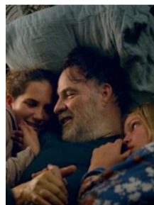
C'est ça l'amour de Claire Burger ► Arcs Film Festival 15-22 décembre 2018